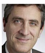
Dr François Pralong

Les quatre méthodes testées ici sont toutes indolores et non invasives. La plus impressionnante est la cryolipolyse, car lorsqu'on enlève la ventouse, le «bourre-